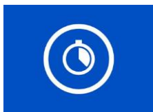
Tid og oppmøte